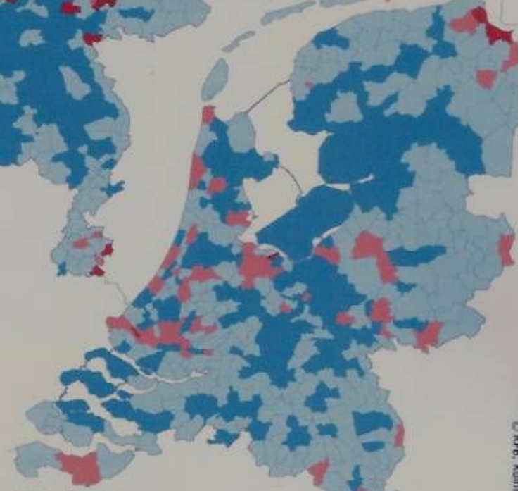
Bevolkingsontwikkeling per gemeente (1995-2005) (kaart 2)

RPPB Krimp = 10% Krimp 5-10% Krimp < 5% Groei < groei NL Groei = groei NL Bevolkingsgroei Nederland: 5,7% Bron: CBS