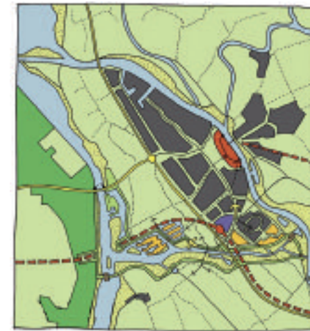
Kampen in 2020

Onderstaande tekening laat zien hoe het gebied er in de toekomst uit gaat zien. Bijna 400 hectare eeuwenoud cultuurlandschap gaat op de schop. Er komt water en er komt een 'klimaatdijk'. Dat is een lange superterp van 5,5 meter hoog en 80 meter breed, waar 1100 woningen op en aan komen te staan. Deze 1100 woningen zijn bedoeld voor Zwolle (dat heet de 'regionale woningbouwopgave').